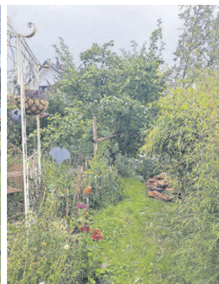
Auch Familie Marc Zoll war mit diesem ansprechenden und abwechslungsreichen Naturgarten unter den Bestplatzierten.

Mehr Informationen finden Sie auf Seite 3