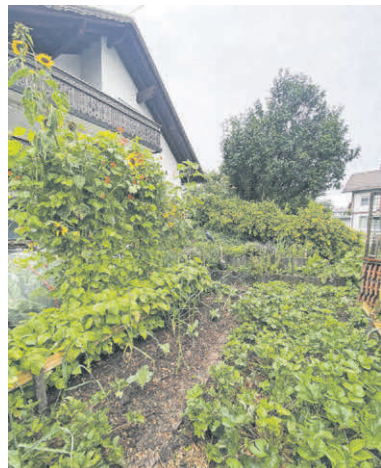
Familie Sigarda Gaibler wurde mit diesem schönen und vielfältigen Naturgarten ausgezeichnet.