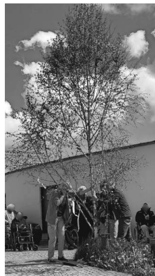
Maibaum am Seniorenzentrum