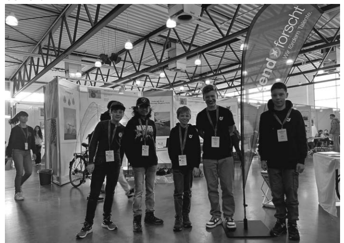
Jungforscher beim Landeswettbewerb

Sonderpreise für Ochsenhauser Jungforscher beim Landeswettbewerb