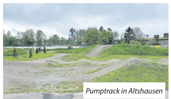
Pumtrack in Altshausen

Beispielsweise der Pumtrack in Altshausen für Radfahrer aller Altersklassen und der „Auszeitgarten“ – ein kleines Feriendörfchen mit zwei Tiny-Häusern, einer Sauna und Whirlpool in Tannhausen bei Aulendorf. In der Mittagspause konnte ein weiteres Kleinprojekt besichtigt werden: Das „Lädele“ im Bauernhausmuseum Wolfegg, bei dem die Umgestaltung des Verkaufsbereichs im Rahmen eines Kleinprojekts gefördert werden konnte. Wer weitere Inspirationen braucht, was alles über LEADER möglich ist, findet auf der Webseite www.re-wa.eu eine Auflistung mit allen Projekten, die bisher zum Zuge gekommen sind.