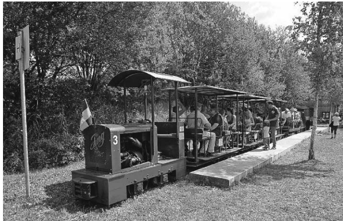
Moorbahnle Bad Wurzach