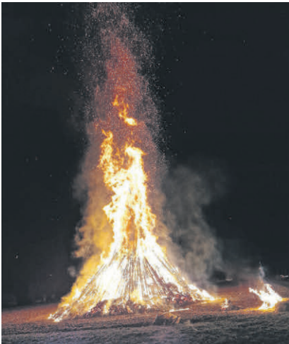
Umbrechts / Ellwangen