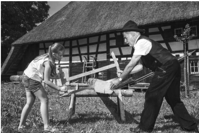
Schmiedin, Zimmermann, Korbflechterin und Co.: Die Besucherinnen und Besucher erleben beim Historischen Handwerkertag am Sonntag, 3. Mai im Museumsdorf Kürnbach hautnah traditionelle Arbeiten.

Wer ordentlich schafft, muss sich auch stärken. Mit oberschwäbischen Spezialitäten, traditionellen Leckereien aus dem Backhäusle und verschiedenen Imbissständen ist für das leibliche Wohl gesorgt. Wer ein hübsches Andenken mit nach Hause nehmen möchte, wird bei den handgefertigten Produkten der Handwerker fündig.