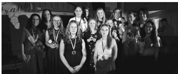
Bei der Kreismeisterschaftsehrung in Bad Schussenried