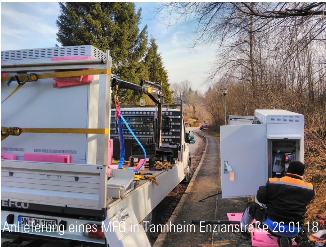
Anlieferung eines MFG in Tannheim Enzianstraße 26.01.18