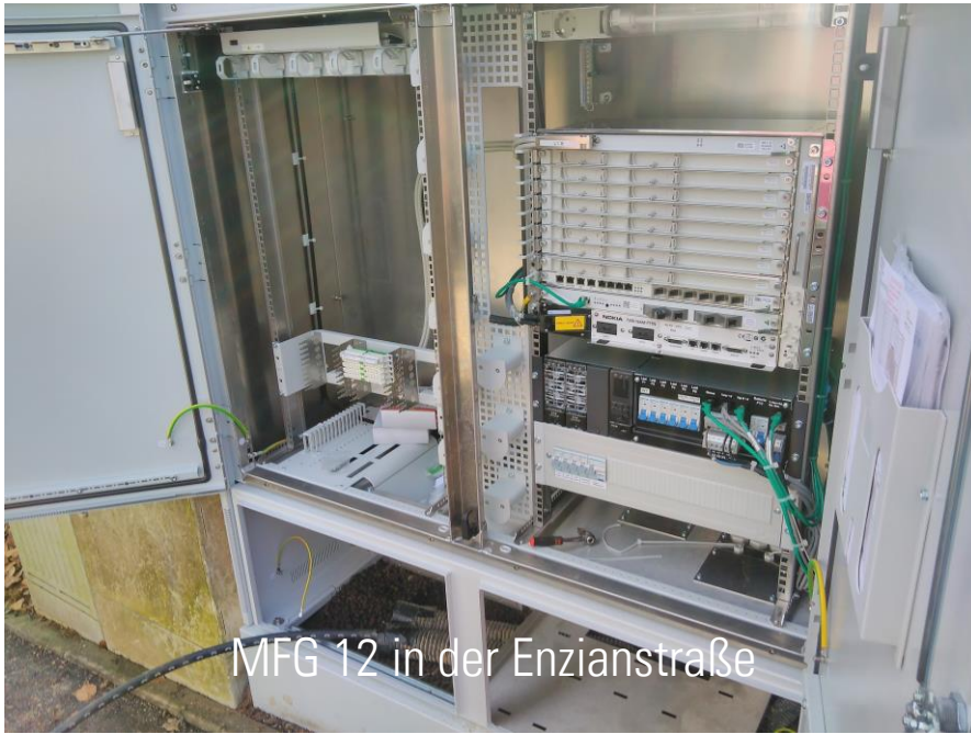
MFG 12 in der Enzianstraße