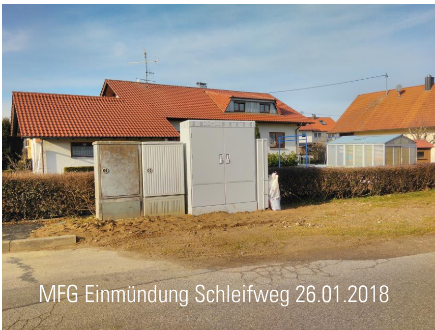
MFG Einmündung Schleifweg 26.01.2018